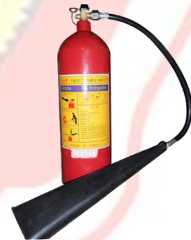
(một số công cụ hỗ trợ)